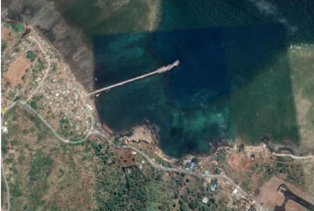
Port de BOINGOMA

La description des infrastructures existantes sera donnée plus précisément dans le Dossier d’Appel d’Offres. Il est proposé aux candidats de réaliser une visite de site dès cette phase de Sélection Initiale, afin que les candidats puissent voir l’état actuel des ouvrages existants et poser les questions nécessaires lors de cette visite de site.