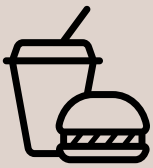
Food & Beverages

Halal Trade, Logistics and Manufacturing Expo will further strengthen Africa's position as a global halal hub and put forward the economic values of Halal for the world.